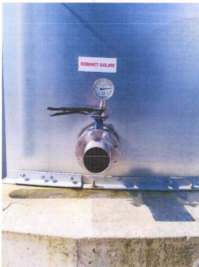
Fig 5 Conducta de golire