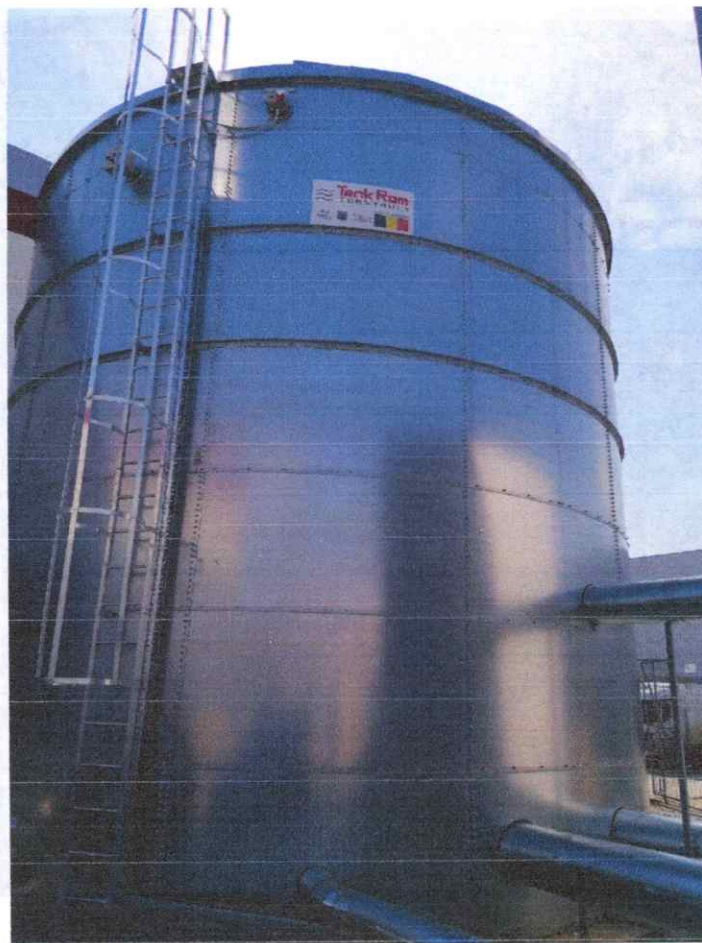
Fig. 3 Rezervorul metalic cu capacitatea de 400 m 3 din loc. Apahida, jud. Cluj