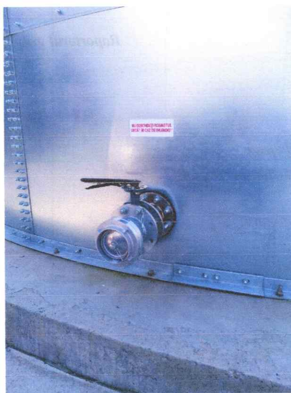
Fig. 4 Racord PSI