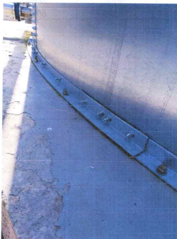
Fig. 2 Fixarea rezervorului de fundație cu suporturi de ancoraj și ancore din oțel M16