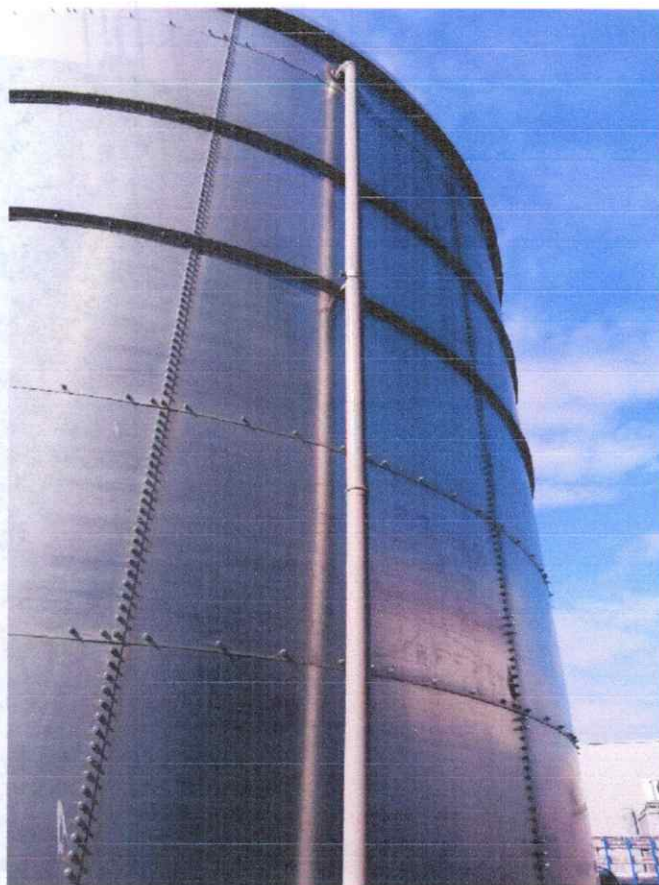
Fig. 6 Teavă preaplin

Raportorul grupei specializate nr. 5 CS ing. László Széll